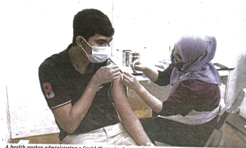
A health worker administering a Covid-19 vaccine booster shot at the Soka Gakkai vaccination centre in Klang on Wednesday.