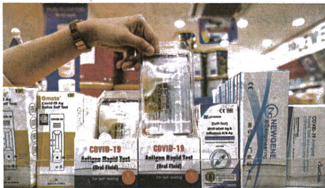
Kit Ujian Pantas Antigen Covid-19 di pasaran yang dilihat antara barang keperluan rakyat ketika ini.

"Sehubungan itu, penguatkuasaan, pemeriksaan dan pemantauan oleh Bahagian Penguatkuasa KPD-NHEP (Kementerian Perdagangan Dalam Negeri dan