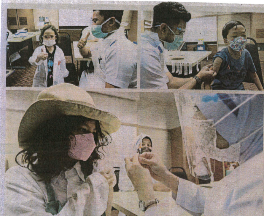
GOLONGAN kanak-kanak menerima vaksin pada Program Imunisasi Covid-19 Kebangsaan Kanak-Kanak (PICKKids) di Putrajaya, semalam.

AKHBAR : HARIAN METRO MUKA SURAT : 6 RUANGAN : COVID-19