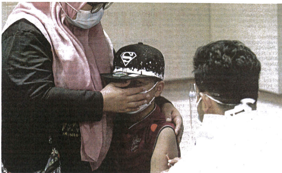
A guardian comforting a boy as he receives a dose of a Covid-19 vaccine in Putrajaya yesterday.

"Theoretically, oral and nasal vaccines will be easier to administer en masse and should be cheaper since there is no need for the use of syringes and needles.