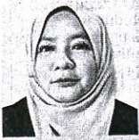
Pensyarah Kanan Fakulti Syariah dan Undang-Undang Universiti Sains Islam Malaysia (USIM)

Oleh Dr Noor Dzuhaidah Osman bhrencana@bh.com.my