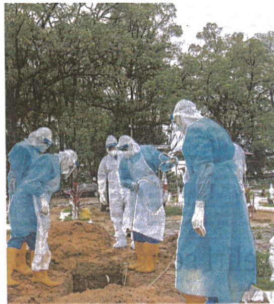
48 kes daripada 113 kematian akibat COVID-19 kelmarin adalah kes tertunggak atau dilaporkan melebihi tempoh 72 jam. (Foto hiasan)

"Paling tinggi kategori yang dikesan semalam (kelmarin) ada-