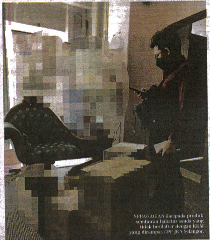
SEBAHAGIAN daripada produk semburan habbatus sauda yang tidak berdaftar dengan KKM yang dirampas CPF JKN Selangor.

Semua produk itu dianggarkan bernilai RM32,500 Dr Sha'ari